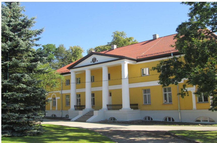
Vērgales muiža, pašreiz Vērgales pamatskola