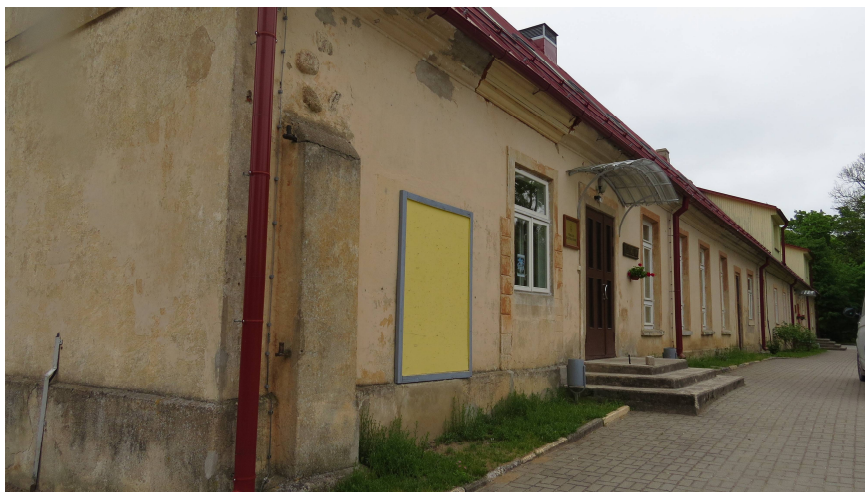
Vērgales kultūras nams un Vērgales klientu apkalpošanas centrs, bijusī muižas klēts

Projekta realizācijas rezultātā plānots saglabāt Pāvilostas novada kultūrvēsturisko mantojumu, nodrošinot plašu tā pieeju sabiedrībai. Galvenie uzdevumi ir restaurēt Vērgales muižas kompleksu atbilstoši tā vēsturiskajam veidolam, lai saglabātu un autentiski atjaunotu Vērgales muižas kompleksu atbilstoši Valsts kultūras pieminekļu aizsardzības inspekcijas izvirzītajām prasībām un saglabātu tā vērtības nākamajām paaudzēm. Sakārtota apkārtējā vide jau no mazotnes audzina jauno paaudzi būt atbildīgam par kultūrvēsturiskajiem un dabas objektiem, tos novērtēt saglabāt.