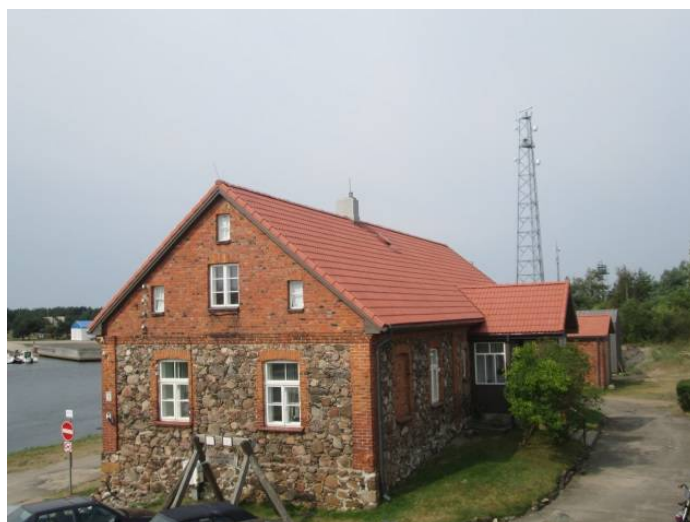
Pāvilostas novadpētniecības muzeja ēka

Pāvilostas novadpētniecības muzejam, bijušajai Loču mājai, kopā ar laivu novietni un Sakas upes bruģi ir piešķirts vietējās nozīmes valsts aizsargājamā kultūras pieminekļa statuss (Valsts aizsardzības Nr. 8661). Ēkām un krasta bruģa kompleksam gadsimtu garumā bijusi svarīga loma pilsētas kā ostas attīstībā un izmantošanā. Tagad tas ir Pāvilostas kultūras tūrisma nozīmīgākais objekts, būtisks kultūrvēstures izziņas avots ar vērā ņemamu muzeja fondu bagātību. Muzejs ir viens no retajiem muzejiem Latvijā, kas veltīts zvejsaimniecības attīstībai. Muzejā ir savākts ap 2000 eksponātu, kas veltīti zvejniecībai. Muzeja ekspozīcijai tiek piedāvāti lielgabarīta eksponāti, bet nav telpu, kur tos izvietot. Plānots pašreizējā malkas šķūņa vietā izbūvēt lielgabarīta eksponātu ekspozīcijas zāli, kur izvietot lielgabarīta eksponātu ekspozīcijas zāli un invalīdu WC. Muzejam ir problēmas ar invalīdu pieejamību, kāpnes, kas ved muzejā ir stāvas un piekļuve cilvēkiem ar kustību traucējumiem ir stipri problemātiska.