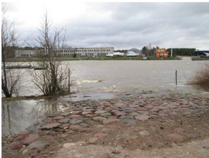
Tiek noskalots arī vēsturiskais bruģis pie Laivu mājas