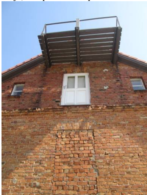
Muzeja ēkas otrajam stāvam, pēc VUGD prasībām, nepieciešamas ārējās metāla kāpnes, kas ugunsgrēka gadījumā nodrošinātu evakuāciju pa ēkas ārpusi