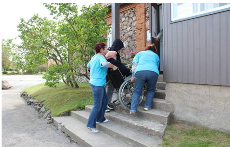
Kāpnes, kas ved muzejā, nav piemērotas personām ar kustību traucējumiem