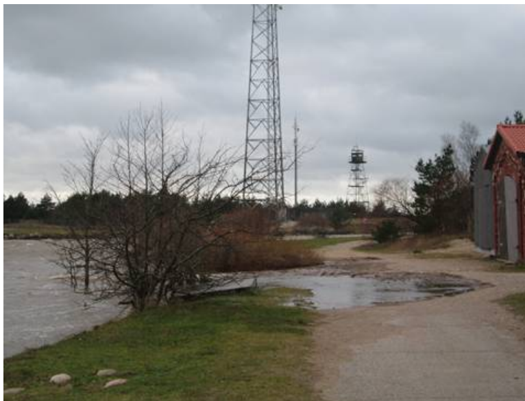
Ūdens līmenis Sakas upē ceļas un skalo ēku pamatus

Lieli vēju un vētru laikā, kad ūdens no jūras ieplūst Sakas upē, upes krasts ir samērā zems, ūdens līmenim ceļoties, ūdens appludina krastu, tai skaitā muzeja ēkas pamatus, laivu māju un vēsturisko Sakas upes krasta bruģi. Projektā plānots ne tikai sakārtot muzeju un tā apkārtni, bet arī veikt preventatīvus pasākumus Sakas upes krasta nostiprināšanai posmā no Dzintaru ielas sākuma līdz Ziemeļu molam, izveidojot labiekārtotu promenādi.