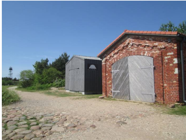
Muzejam blakus esošā Laivu māja ar Sakas upes bruģa fragmentu un Pāvilostas SERF klubu