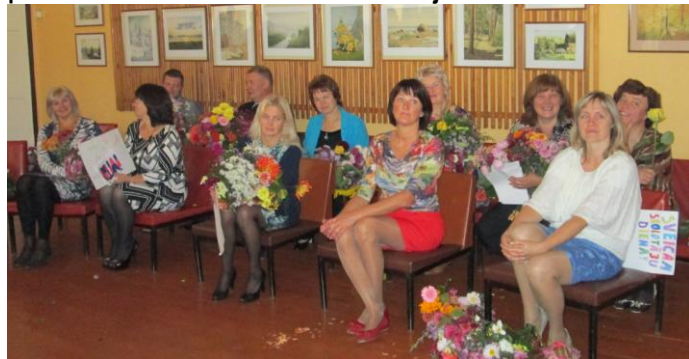
Vērgales pamatskolas skolotāji.

4.oktobrī ar ziediem un dziesmām Vērgales pamatskolā skolēni sveica savus skolotājus.