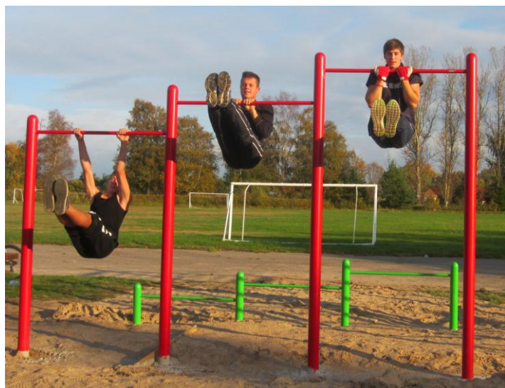
Pāvilostas stadionā jau uzstādīti pirmie jaunie vingrošanas rīki.