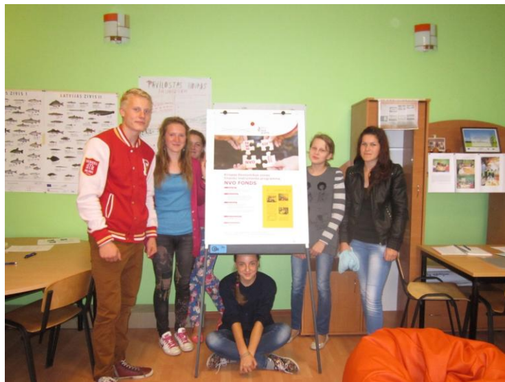
Daļa jauniešu jau pieraduši, ka var uzturēties, darboties un atpūsties biedrības telpās.

Daļa jauniešu jau pieraduši, ka var uzturēties, darboties un atpūsties biedrības telpās. Tiek skatīti foto un videomateriāli no jau realizētiem projektiem, filmas.