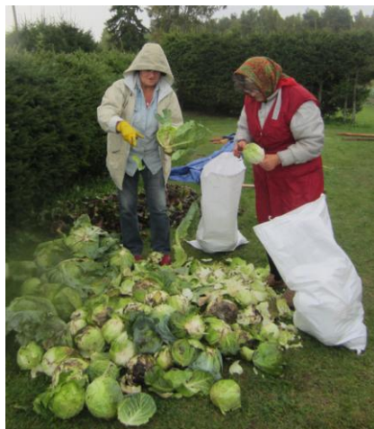
Brīvprātīgie „Laiveniekos” strādā pie ražas novākšanas.

Izdarīts jau ir daudz – daļēji renovēta dzīvojamā māja, piemājas zemē tiek audzēti dārzeņi, top arī liela un skaista dobe, kas pielāgota invalīdiem ratiņkrēslos. Augi tiks stādīti uz paaugstinājuma, lai invalīds varētu tos ērti aplūkot un pasmaržot. Būšot arī pirtiņa un dīķis makšķerēšanai ar īpašajiem neredzīgajiem pielāgotajiem pludiņiem u.c.