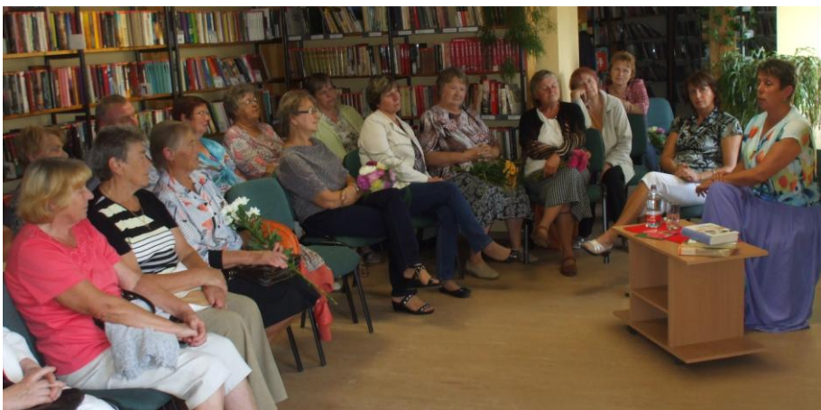
Tikšanās ar rakstnieci I.Baueri bija bagātīgi apmeklēta.