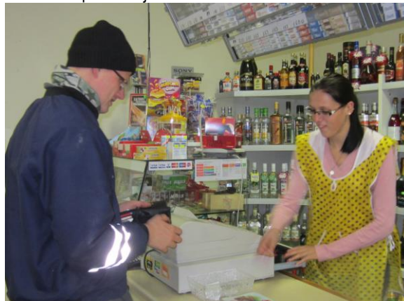
Ziemupes veikalā pircēju netrūkst.

Iegriežāmie arī Ziemupes veikalā – bagātīgi un gaumīgi iekārtotā. Pārdevēja Baiba Treibaha mums pastāsta, ka cilvēki ar veikala sortimentu ir apmierināti, vasarā, kad Ziemupē daudz atpūtnieki, veikalā reizēm pat veidojas rinda.