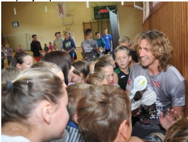
A.Samoilovs daļa autogrāfus skolēniem. Foto no www.rekurzeme.lv .

27. septembrī visā Latvijā norisinājās Olimpiskā diena, kuras devīze – „Esam sportiska ģimene”. Visā valstī pasākuma dalībnieku skaits sasniedza vairāk nekā 87 tūkstošus. Šogad pasākumā piedalījās arī Pāvilostas vidusskolas skolēni. Gandrīz katru no skolām apciemoja kāds no pazīstamiem Latvijas sportistiem, kurš bijis arī Olimpiskajās spēlēs. Mūsu skolas Olimpiskais vēstnesis bija pludmales volejbolists Aleksandrs Samoilovs, kurš, tiekoties ar skolēniem, stāstīja par saviem sasniegumiem Latvijā un ārpus tās, kā arī dalījās savos iespaidos par Olimpiskajām spēlēm.