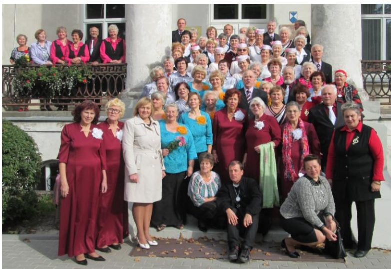
Senioru ansamblis pie Vērgales pamatskolas.

Saviesīgajā daļā muzikants Vilnis gādāja par atraktīvām dejām. Vircavas deju ansamblis starobrīžos sniedza vēl papildus priekšnesumus, un viņu piemēram sekoja arī dziedošās meitenes no Liepājas „L.A.I.M.A.”.