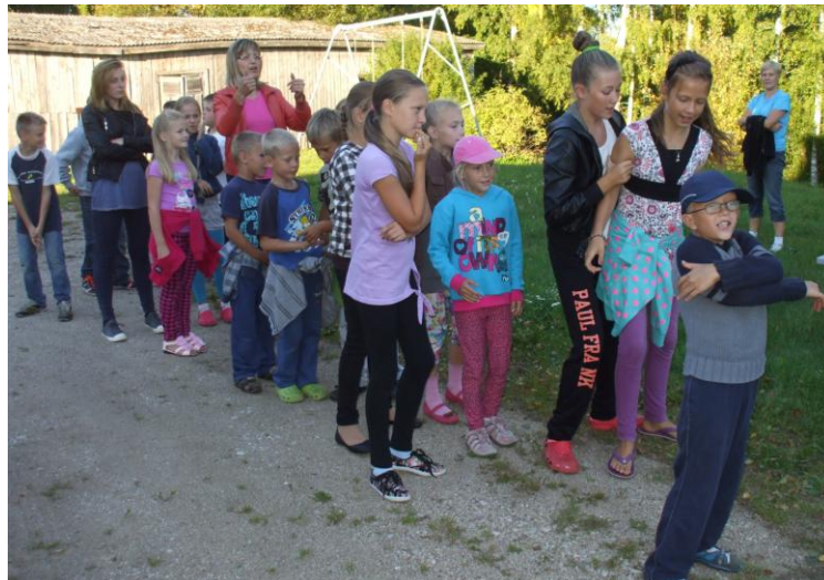
Gaidot vakariņu zupu, bērni spēlēja spēles kultūras nama kalnā.

Jau 12 gadus Latvijas bibliotēkās ir lasīt veicināšanas programma Bērnu, jauniešu žūrija, tajā iesaistās arī Pāvilostas bibliotēkas darbinieces.