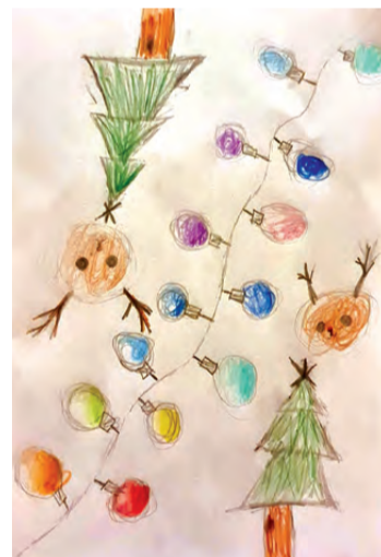
Radošākā vai atraktīvākā Ziemassvētku kartīte – Šarlote Dominika Stendze (1. klase).