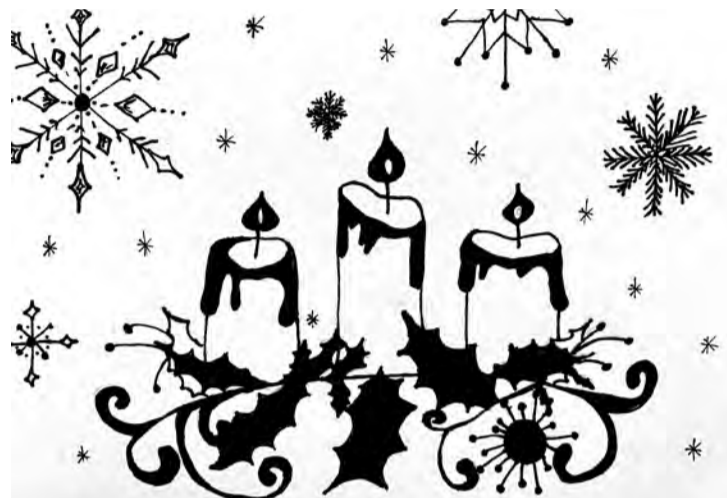
Klasiskākā Ziemassvētku kartīte – Katrīna Antonoviča (4. klase).