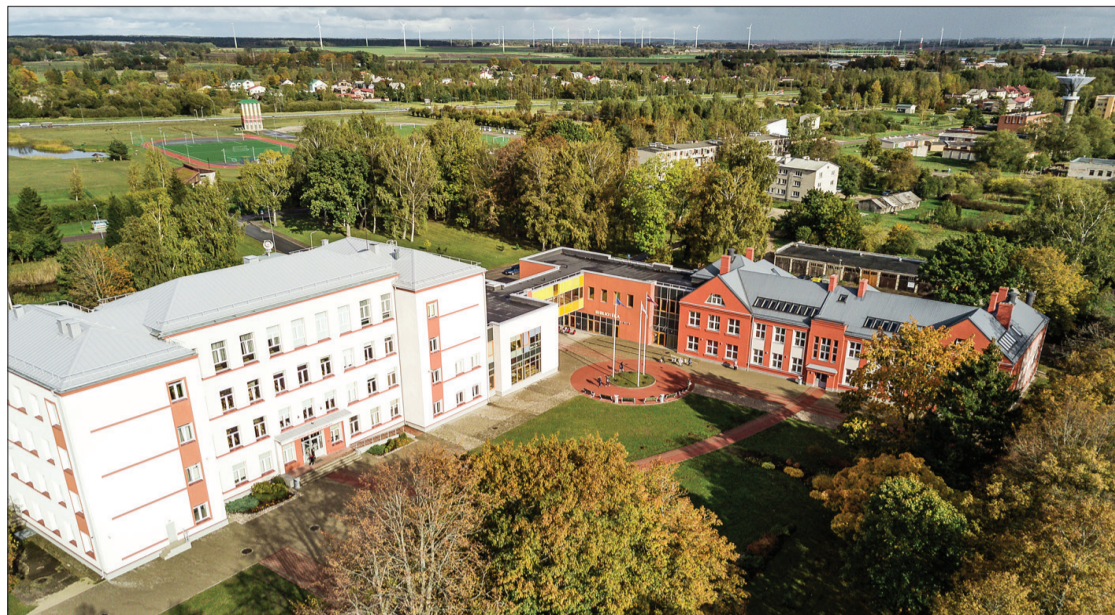
Zentas Mauriņas Grobiņas vidusskola ir izglītības iestāde, kur visiem kopā augt un nobriest kā personībām.

Šajā mācību gadā Zentas Mauriņas Grobiņas vidusskolu par savu sauc 910 skolēni, 118 pedagogi un 39 tehniskā personāla darbinieki. Ik rītu un pēcpusdienu nodrošinām piecus skolēnu autobusu maršrūtus – Bārtas, Gaviezes, Dubeņu, Kapsēdes un Dunalkas virzienos. Mēs esam skola, kuras misija saklausāma, saredzama un sadzirdama vārdā KATRAM (Kvalitāte, Atbildība, Tālredzība, Reālā dzīve, Arodizglītība, Metodiskais centrs), jo mēs nodrošinām kvalitāti un konkurētspēju, augsti vērtējam ikviena atbildību, esam tālredzīgi un sasaistē ar reālo dzī-