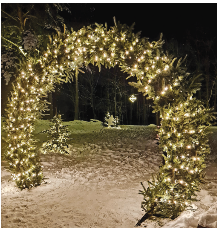
Medzes pagastā pie kultūras nama, izejot cauri izgaismotai egļu arkai, nonākam teiksmaini mirdzošā valstībā.