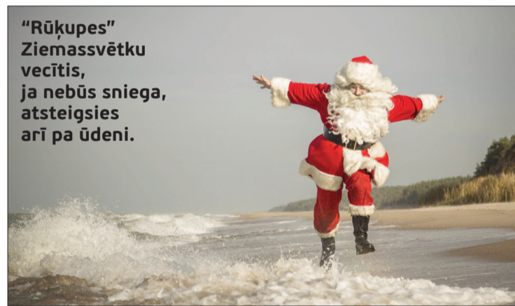
“Rūķupes” Ziemassvētku vecītis, ja nebūs sniega, atsteigsies arī pa ūdeni.

šās krāsās dienas tumšajās stundās) un Pāvilostu, bet nākamajā dienā lai ceļi ved uz leišmalīti – Kalēti-Priekule-Vaiņode-Embūte. Ja vien būs sniegš, noteikti jāpaķer līdzī kāds šūcamais, lai Volbahā un Embūtes pakalnos baudītu tās sajūtas, ko sniedz laišanās