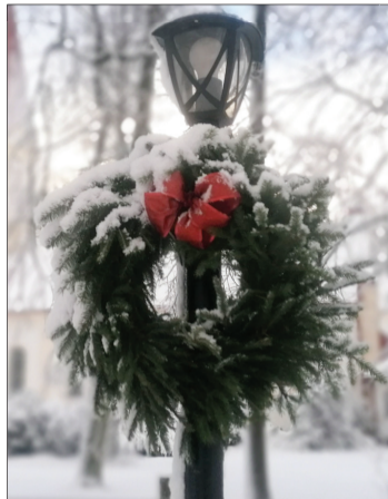
Rucavā pie laternu stabiem uzstādīti Adventes vainagi.

Nīcas centrā ilgu gadu slējas liela un skaista egle, kura tradicionāli ceļu uz pagastu mēroja no meža un tika uzstādīta pie domes ēkas, līdz kāda spēcīga vētra to