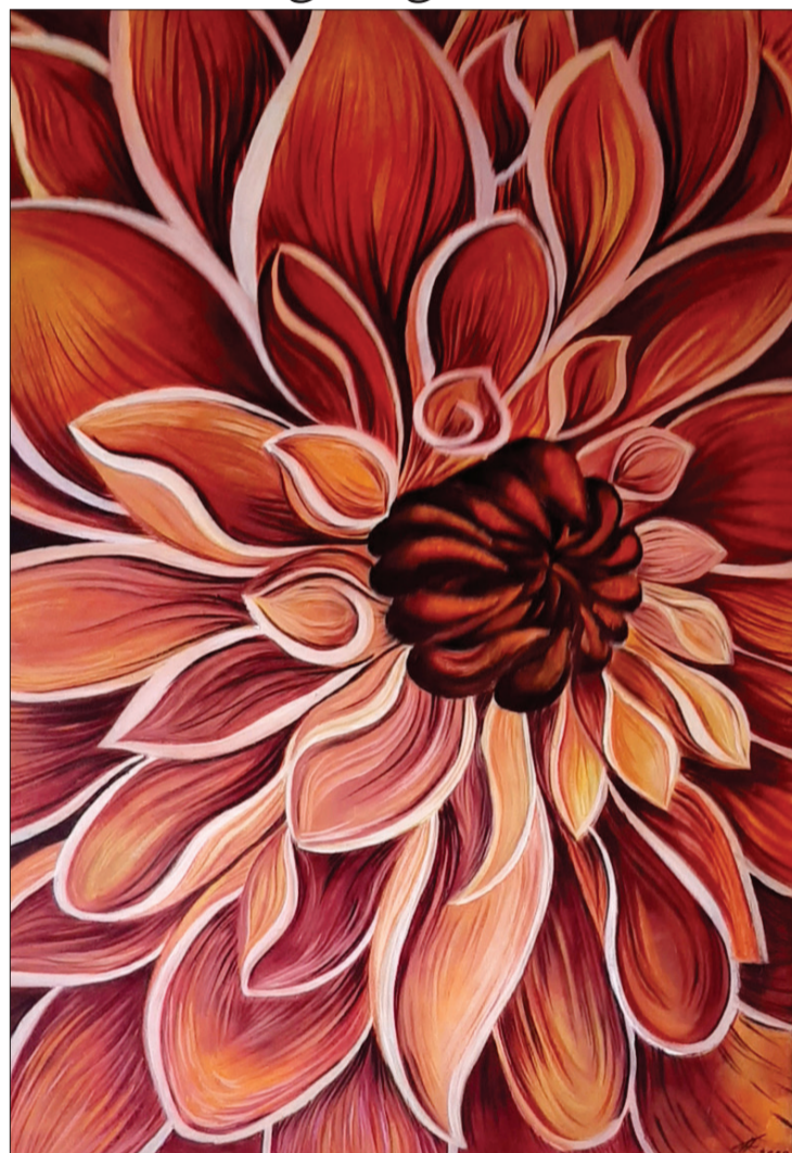
"Dālija" – tik skaista!