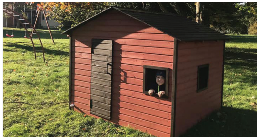
Biedrība “Dārza 4” projektā “Rotaļu namiņš” iepriekš labiekārtoto bērnu rotaļu laukumu papildināja ar rotaļu namiņu.

Nīcas pagasta “Upeskrastos” pie Bārtas upes atjaunotās kāpnes izmantos gan Nīcas airēšanas skolas jaunie airētāji ar savu treneri, gan arī vietējie iedzīvotāji, laivotāji un Nīcas pagasta ciemiņi.