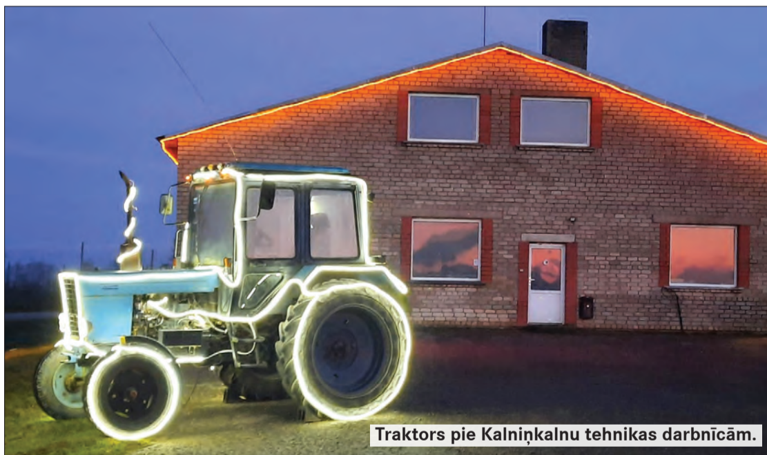
Traktors pie Kalniņkalnu tehnikas darbnīcām.