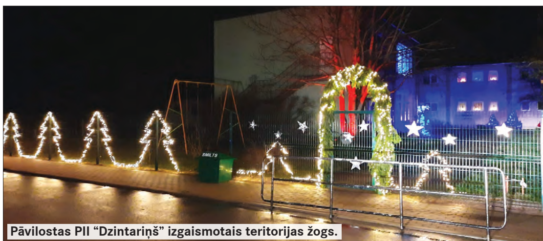
Pāvilstas PII “Dzintariņš” izgaismotais teritorijas žogs.