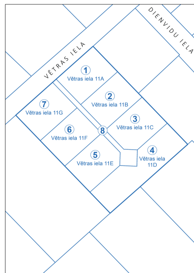
ZEMES VIENĪBU DALĪŠANA UN ADRESĀCIJA