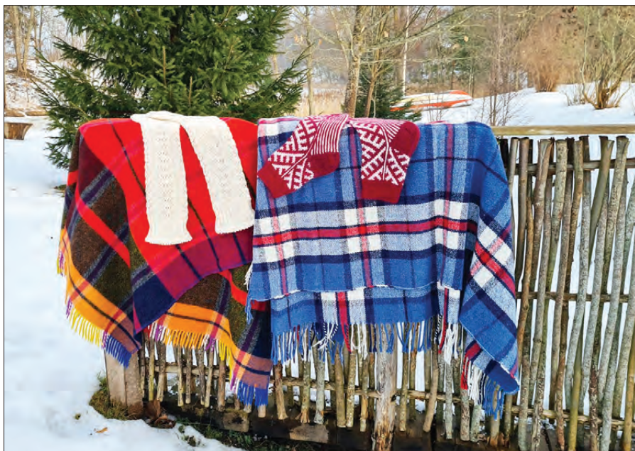
Uz zedeņu žoga izlikti Baibas Blaubārdes pūralādes dārgumi.