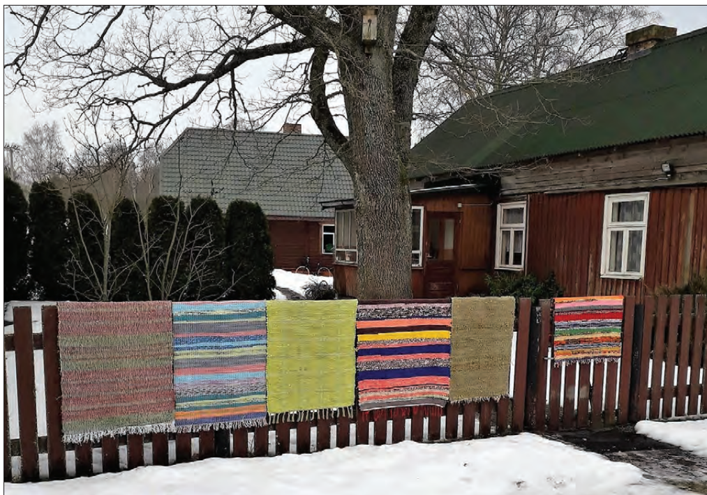
Dzintras Vērnieces pūralādes skaistie deķi.