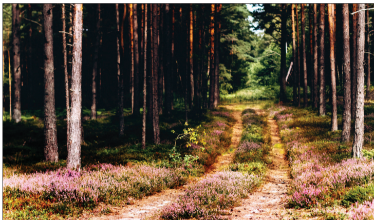
Papes ceļi. Autore Kitija Vamze.

Fotokonkurssā “Dienvidkurzemes novada skaistie skati”, kas norisinājās pirmo reizi, piedalījās 53 fotomednieki ar 112 fotogrāfijām.