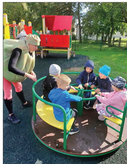
Krāsainā un skaistā vidē nodarbības ir daudz priecīgākas.

Rotaļu laukumu aktīvi izmanto dažādām āra nodarbībām, piemēram, nesēn te notika Eiropas Savienības fonda projekta “Kompleksi veselības veicināšanas un slimību profilakses pasākumi” apmācība “Man ir tīri zobī”, kā arī bērnu vizuālās mākslas darbiņu izstāde un ābolu mandalas veidošanas nodarbība.