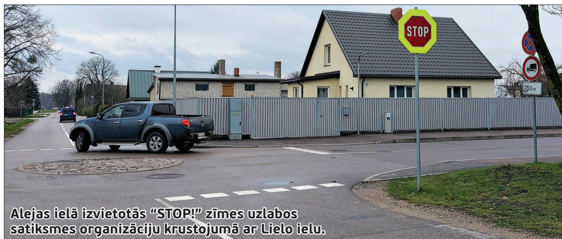
Alejas ielā izvietotās “STOP!” zīmes uzlabos satiksmes organizāciju krustojumā ar Lielo ielu.