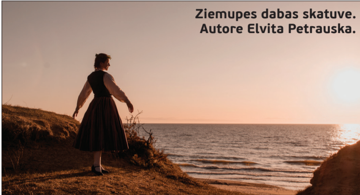
Ziemupes dabas skatuve.