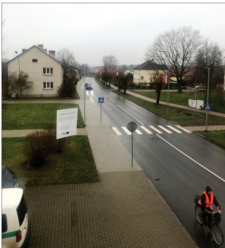
Grobiņā atjaunota Lielā iela 386 metru garumā un Ventspils ielas posms 21 metra garumā.