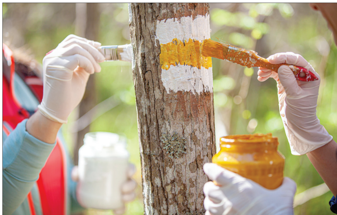
Ārpus pilsētām “Mežtakas” maršruts iezīmēts ar krāsojumu uz kokiem: balts-dzeltens-balts.

“Mežtakas” Dienvidkurzemes novadā aizsākas Kalētu pagastā, pie Latvijas un Lietuvas robežas, un noslēdzas Kazdangas pagastā. Tā izlīkumo cauri visai