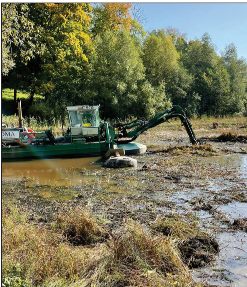
Sedimentācijas baseins pirms gājēju tilta pār Tebras upi nodrošina upes sanešu savākšanu un nostādināšanu.

Sedimentācijas baseina izveidi finansējusi Dienvidkurzemes novada pašvaldība. Darbus veica uzņēmums SIA “RR Nord”. Kopējās izmaksas 19 858,41 EUR (bez PVN).