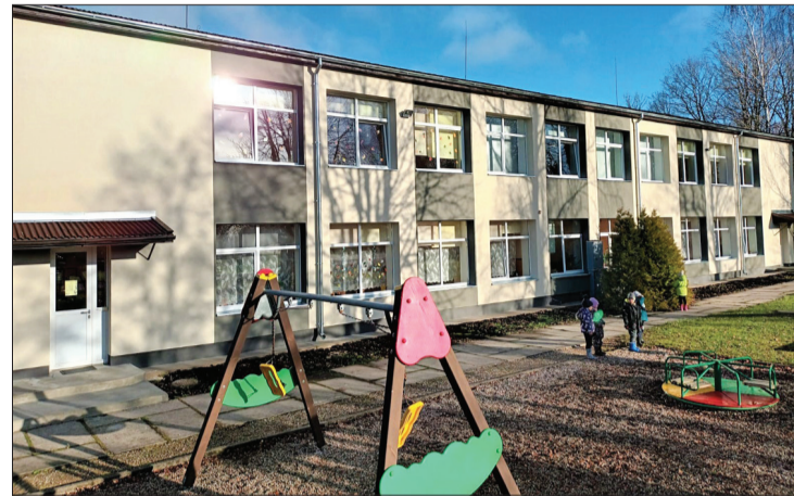
Par vizuāli skaistajām pārmaiņām īpaši priecājas pirmsskolas darbinieki un audzēkņi.

Būvdarbus veica “JAR Celnieks un CO”. Darba kopējās izmaksas 92 278,82 EUR (bez PVN).