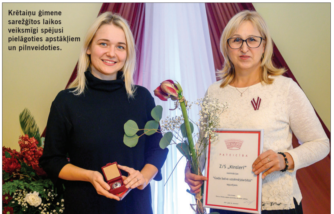
Krētaiņu ģimene sarežģītos laikos veiksmīgi spējuši pielāgoties apstākļiem un pilnveidoties.